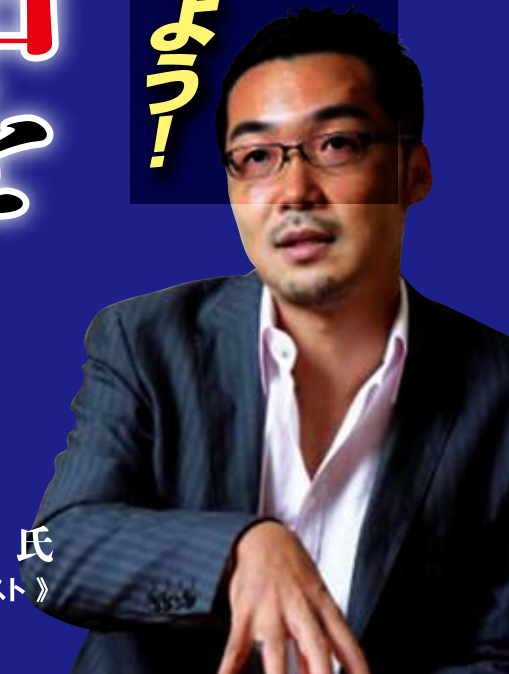
上杉 隆 氏 《ジャーナリスト》