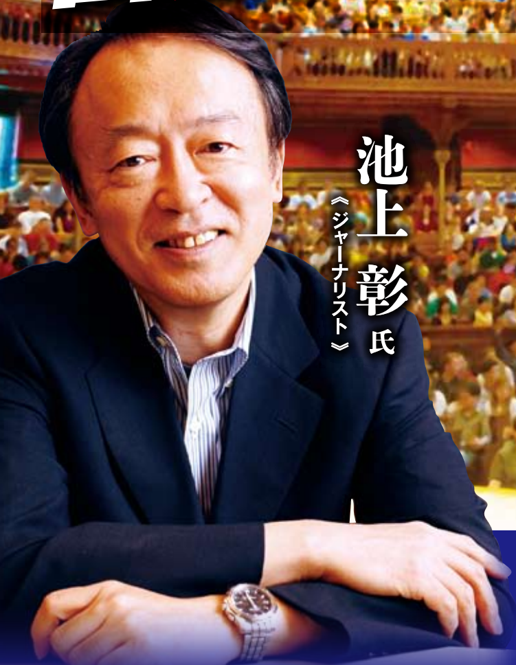
池上 彰 氏 《ジャーナリスト》